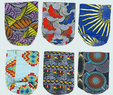
様々なバリエーションがあります！

華やかなデザインのもの、作業をしながら明るい気持ちになれます。コロナの影響から、内職作業はなかなか増えない状況が続いていますが、そんな中、新しい作業は気分転換にもなりそうです。