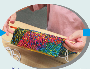
生地のポケットに通して…