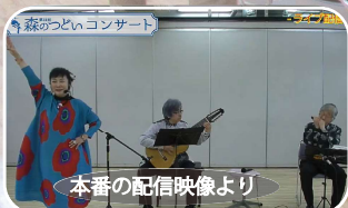
本番の配信映像より